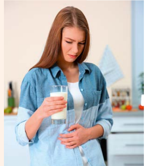
Milchprodukte führen bei Laktose-Intoleranz häufig zu Bauchschmerzen und Übelkeit.

Prinzipiell gilt: Je länger der Käse gereift hat, desto weniger Laktose enthält er. Dagegen