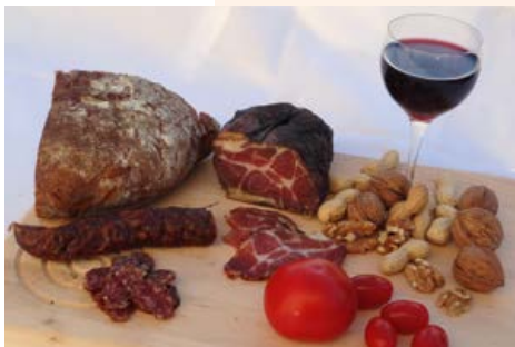
Für etwa 3 % der Bevölkerung ein Problem: Wein, Räucherwaren wie Salami und Schinken, aber auch Brot enthalten Histamin.

Aminosäuren entstehen. Dazu gehört auch Histamin. Im Organismus fungiert es als Gewebshormon und Neurotransmitter und spielt eine zentrale Rolle bei allergischen Reaktionen. Histamin ist an der